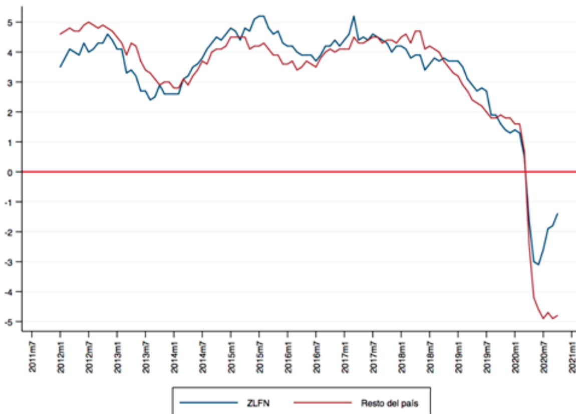
Gráfica 1: Crecimiento mensual del empleo formal en la Zona Libre de la Frontera Norte (ZLFN) y el resto del país. (2011m1-2020m10).