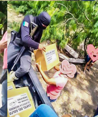
VALOR POR TAMAULIPAS