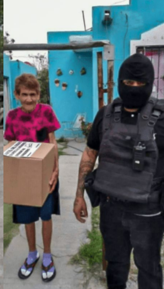
MÉXICO CÓDIGO ROJO