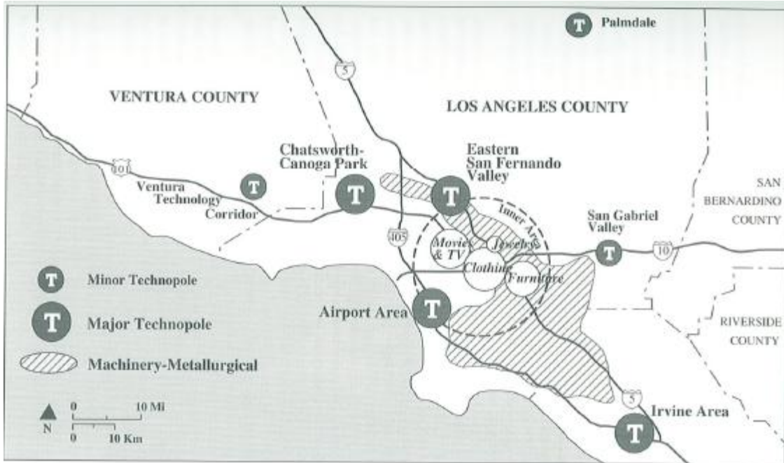
Mapa II.2 Geografía industrial de la región de Los Ángeles a finales del Siglo XX