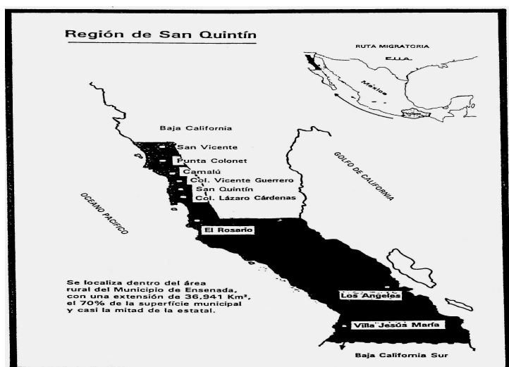
Mapa 1. Ubicación de las delegaciones en el Valle de San Quintín.

Finalmente, Rosario Arriba y Rosario Abajo cierran el cinturón del Valle. En estas localidades se observa una producción agrícola prácticamente nula, por lo que el caserío se encuentra casi despoblado.