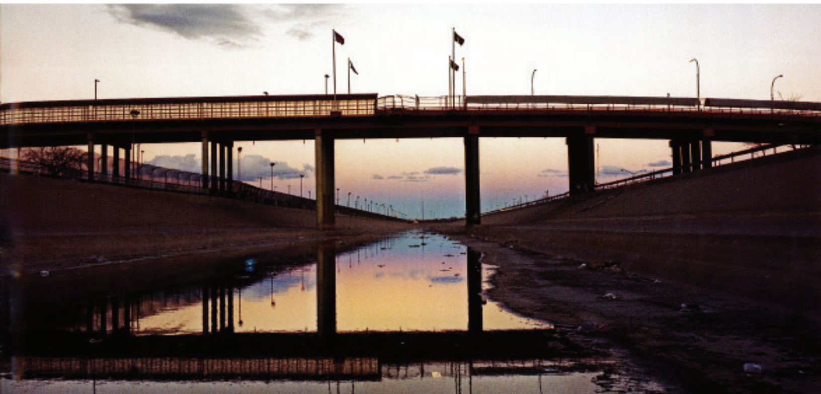
FOTOGRAFÍA: GUILLERMO ARIAS · EL CERCO

De entrada, los episodios de violencia constituyen un desafío para el gobierno estadounidense, no sólo porque refiere a un problema de seguridad interna, sino también porque se trata de una violencia que se materializa en espacios poblados de hispanos en una proporción considerable, o bien de una violencia selectiva, que tanto en términos ideológicos como empíricos, se orienta a la población hispana bajo argumentos xenofóbicos o, en su extremo, racistas.