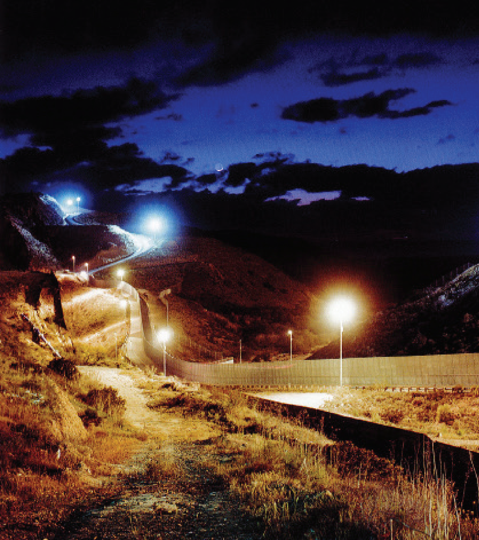
EL CERCO CAÑÓN DE LOS LAURELES, TIJUANA BAJA CALIFORNIA, 2014.